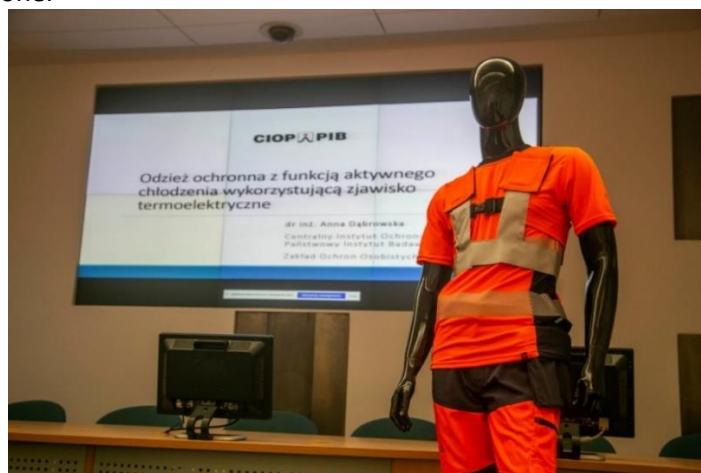
Fot. Prezentacja prototypu podczas spotkania w KGHM Miedź Polska S.A.

Ww. rozwiązanie ma formę bardzo lekkich (poniżej 1 kg), dopasowanych do ciała elastycznych szelek, wykonanych z materiałów o bardzo dobrych właściwościach biofizycznych. Funkcję chłodzącą pełni 6 zintegrowanych z nimi elastycznych modułów termoelektrycznych. Przeprowadzone w CIOP-PIB badania wykazały, że prototyp pozwala odebrać z ciała człowieka ok. 50 \text{ W/m}^2 , co można porównać ze zmianą poziomu metabolizmu towarzyszącą zmianie pracy o ciężkości średniej na lekką. Co więcej, zapewniane przez ten sprzęt chłodzenie trwa przez przynajmniej 5 godzin i pozwala na obniżenie lokalnej temperatury skóry nawet o 4^{\circ}\text{C} ! Ale to nie wszystko. Przeprowadzone badania laboratoryjne z udziałem grupy ochotników wykazały również pozytywny wpływ zastosowanego chłodzenia na ograniczenie wzrostu lokalnej temperatury skóry w miejscach, które nie były bezpośrednio chłodzone.