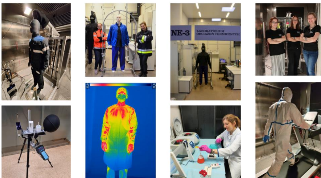
Fot. Pracownia Obciążeń Termicznych CIOP-PIB jest wyposażona w nowoczesną i unikalną w skali kraju aparaturę badawczą, umożliwiającą wykonywanie kompleksowych badań w zakresie oddziaływania mikroklimatu na człowieka znajdującego się w środowisku pracy

Rok 2023 r. był najcieplejszym w historii pomiarów temperatury na świecie, a 22 lipca 2024 r. został pobity rekord średniej globalnej temperatury na świecie. Wg prognoz odsetek populacji europejskiej narażony na wysokie ryzyko stresu cieplnego wzrośnie z 0,4% w 2018 roku do aż 48% w 2050 roku. Konsekwencją długotrwałej ekspozycji na bardzo wysoką temperaturę (a więc pracujących w tzw. mikroklimacie gorącym) mogą być poważne problemy zdrowotne: choroby sercowo-naczyniowe i choroby nerek, udary, wyczerpanie, kurcze cieplne czy omdlenia. Najpoważniejszym z nich jest udar cieplny, występujący wtedy, gdy układ termoregulacji organizmu pracownika nie jest w stanie samodzielnie obniżyć temperatury wewnętrznej. Co więcej, wysoka temperatura obniża koncentrację i zwiększa zmęczenie, co prowadzi do wzrostu liczby wypadków przy pracy.