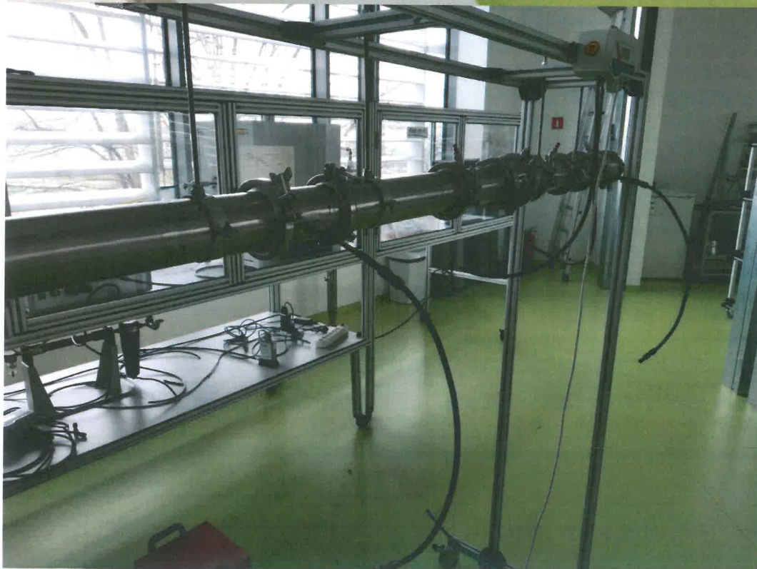
Tri clamp i stanowisko do badania filtrów powietrza