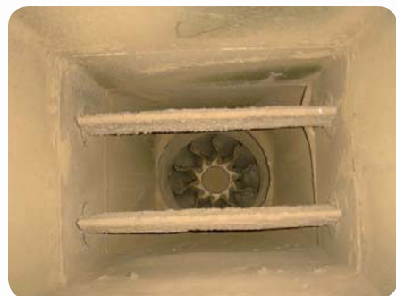
Rys. 3. Wentylator przed czyszczeniem