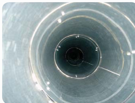
Rys. 4. Kanał wentylacyjny po czyszczeniu